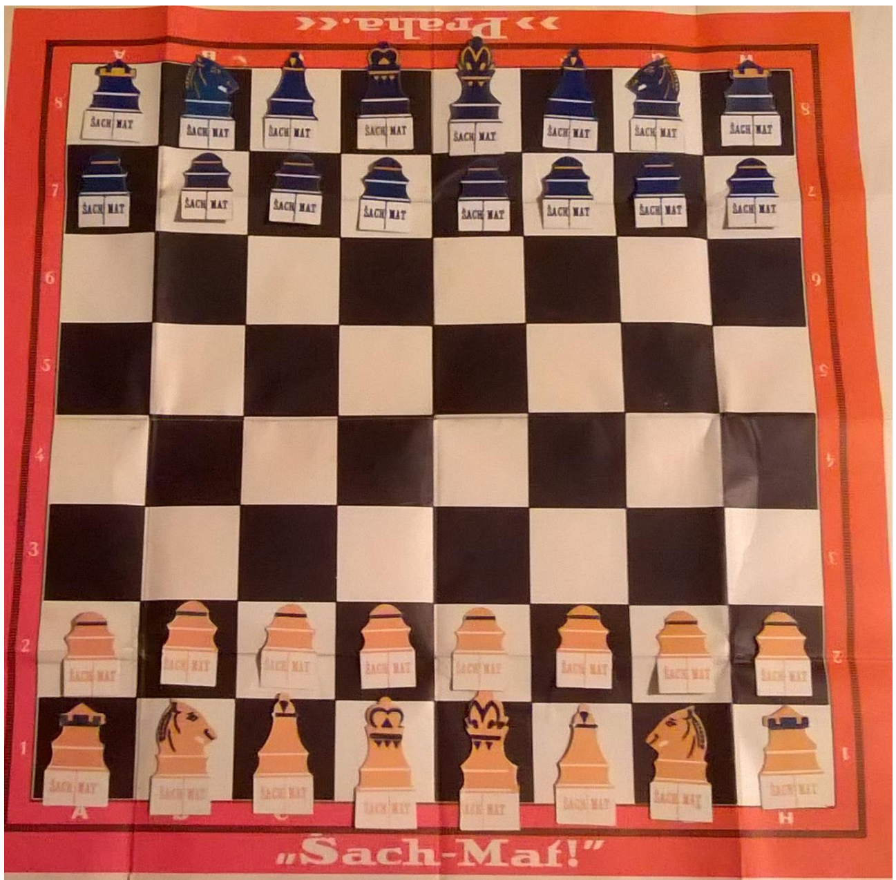
šachovnice s figurkami