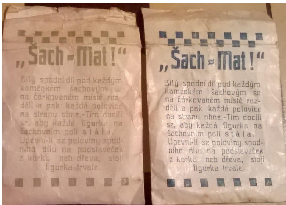
v těchto slušivých sáčcích jsou ukryty figurky s uvedením návodu na jejich zprovoznění